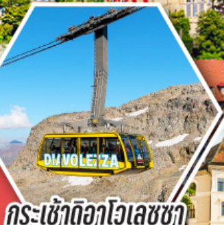
กระเช้าดีอาโวลเลซซา