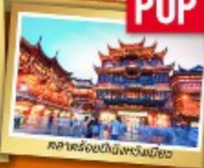
ศาลาร้อยปีชิงหวงเฉียว