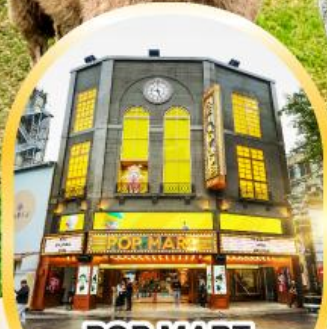
POP MART ใหญ่ที่สุดในไต้หวัน