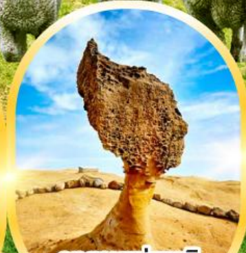
อุทยานแห่งชาติ เย่หลิว