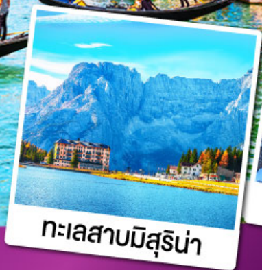
ทะเลสาบมิสุรีน่า