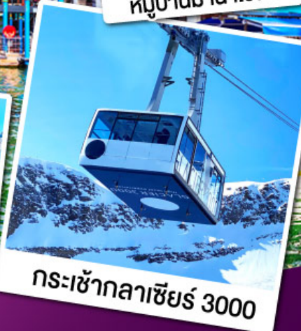
กระเช้ากลาเซียร์ 3000