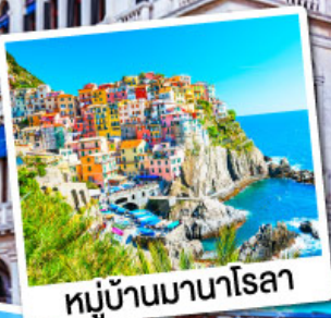
หมู่บ้านมานาโรลา

เที่ยวเก็บครบไฮไลต์โดโลไมท์ ทั้งทะเลสาบมิสุรีน่า ทะเลสาบเบรียสและกระเช้าเอลป์ ดิ ซุสซี