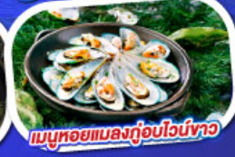
เมนูหอยแมลงภู่อวบน้ำ