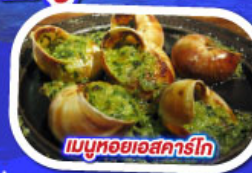
เมนูหอยแอสคาร์โท