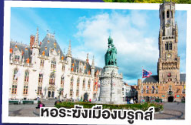
หอระฆังเมืองบรูกส์