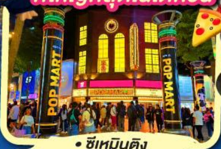
• ซีเหมินตง