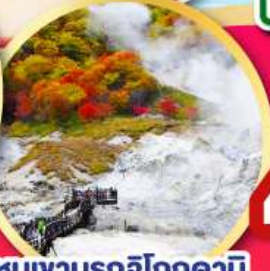
สัมผัสน้ำแร่ธรรมชาติ ณ สวนฟูทาคาชิ