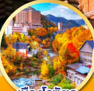
เมืองโจเซ็งเค