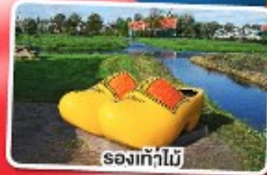
รองเท้าไม้