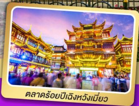
ตลาดร้อยปีเฉิงหวังเหมี่ยว