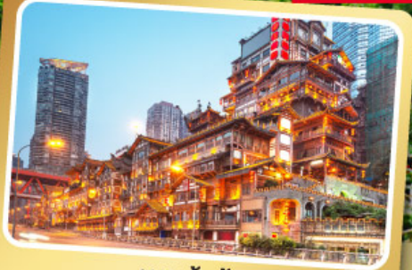
หงหย่าตั้ง