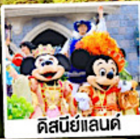
ดิสนีย์แลนด์