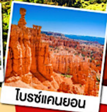
โบรซ์แคนยอน