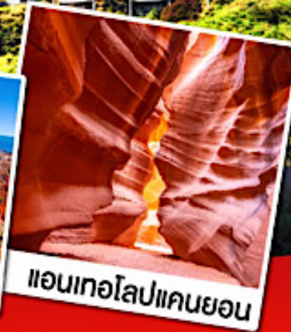
แอนเทอโลปแคนยอน