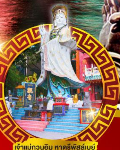
เจ้าแม่กวนอิม หาดริฟส์สีย์