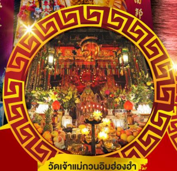
วัดเจ้าแม่กวนอิมฮ่องฮำ