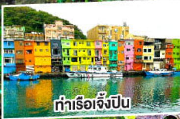
ท่าเรือจิงปิน