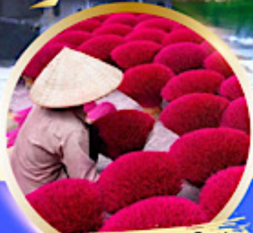
หมู่บ้านรูป Phu Cau