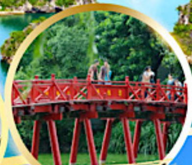
สะพานแสงอาทิตย์