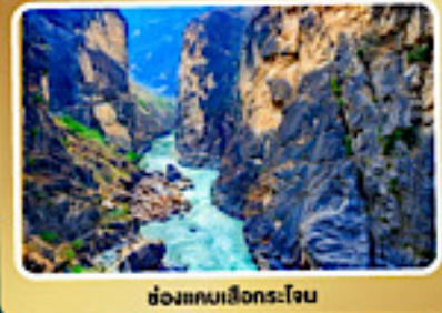
ช่องแคบเสิงกระโจน