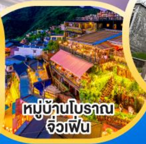
หมู่บ้านโบราณ จิวเฟิ่น