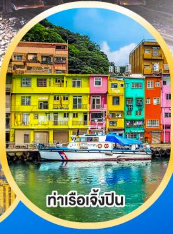
ท่าเรือเจิ้งปิน