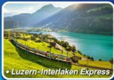
• Luzern-Interlaken Express