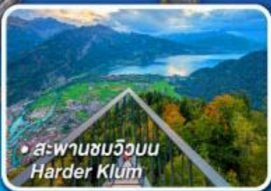
• สะพานชมวิวน Harder Klamm