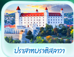
ปราสาทบราติสลาวา

เที่ยวชมเมืองฮัลส์สตัดท์ หมู่บ้านริมทะเลสาบสวยที่สุดในโลก พระราชวังเซินบรุนน์ เมืองลินซ์ จักรีสฮาพท์พลัทซ์ สัมผัสเมืองมรดกโลก เซสกี คุรมลอฟ เยี่ยมชมปราสาทปราก ถนนทองคำ เข็คอินสถานที่ชื่อดัง! ปราสาทบราติสลาวา ส่องเรือชมความงามแม่น้ำดานูบ แม่น้ำที่ยาวที่สุดในยุโรป ชมความน่าหลงใหลของ ปราสาทบูดาเปสต์ สะพานชาร์ลส์