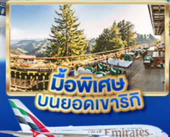
มือพิเศษ บนยอดเขารัก