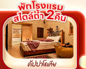
พักโรงแรม สไตล์ท่า 2 คืน