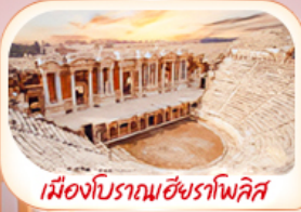
เมืองโบราณเฮียราโพลิส