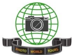
PHOTO WORLD TOURS