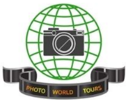
PHOTO WORLD TOURS