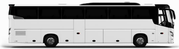
ตัวอย่างรูปภาพรถ 1 ชั้น

หากประเภทห้องที่ท่านริเคอสมาดำเนินการ เช่น ริเคอสองห้องพักเป็น TWIN BED หรือ DOUBLE BED ทางบริษัทขอสงวนสิทธิ์ในการปรับประเภทห้องพัก เป็นตามที่โรงแรมมีอยู่ โดยไม่ต้องแจ้งให้ทราบล่วงหน้า