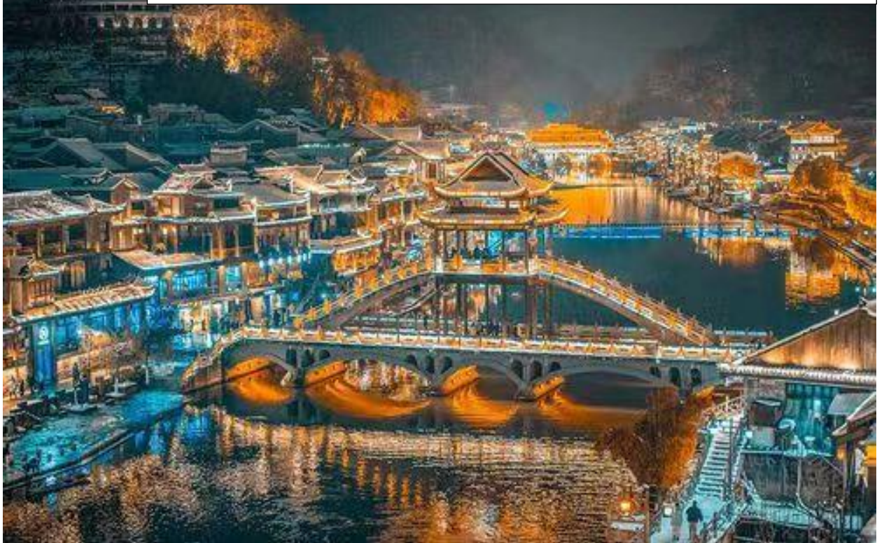
ภาพถ่ายจากสะพาน Fenghuang Bridge ยามค่ำ เมื่อเปิดไฟ หลังพระอาทิตย์ตกดิน

ได้เวลานัดหมาย นำท่านเดินทางไปพักที่จีโซว เมืองไคล์เคียง เพื่อเตียงที่นุ่มกว่า และรับประทานอาหารเช้าแบบ INTERNATIONAL BUFFET