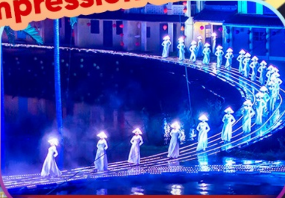
Hoi An Impression Show