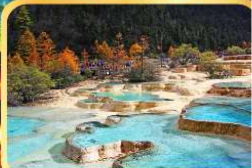
อุทยานหลวงหลงมรดกโลก