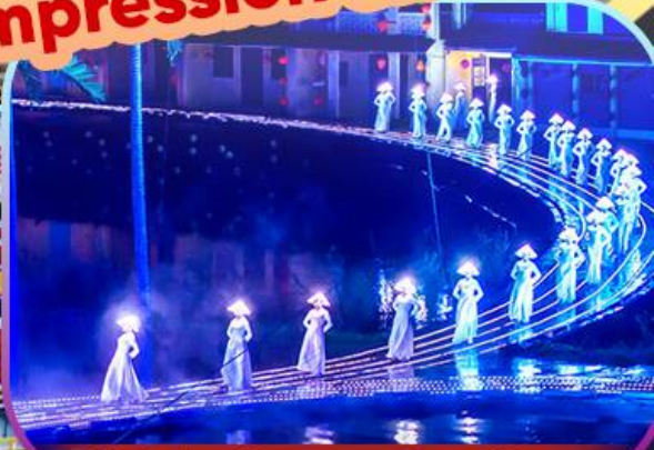
Hoi An Impression Show