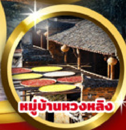
หมู่บ้านหวงหลิง

“อุ๋หมวน หมู่บ้านชนบทที่สวยงามที่สุดของจีน หวงหลิง หมู่บ้านโบราณยุคกลางสืบทอดอายุกว่า 580 ปี ภูเขาหลิงชาน สถานที่ศักดิ์สิทธิ์แห่งที่ 33 ของโลก หอเกิ่งหวัง หอโบราณที่มีชื่อเสียงแห่งเจียงหนาน”