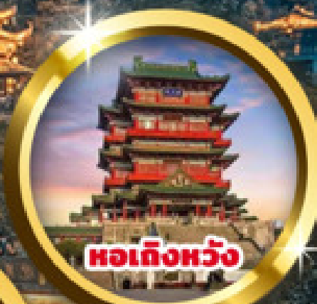
หอเกิ่งหวัง