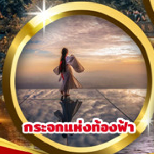
กระเอกแห่งท้องฟ้า