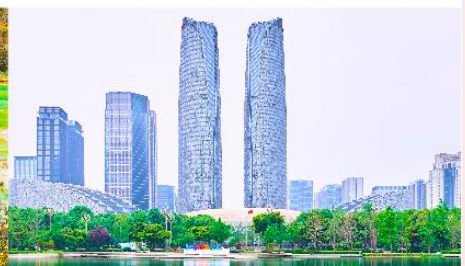
ตึกแฝดเจิงตุ

*ทางบริษัทฯ ขอสงวนสิทธิ์ในการสลับโปรแกรมทัวร์ตามความเหมาะสมขึ้นอยู่กับสถานการณ์หน้างาน โดยคำนึงถึงผลประโยชน์ของลูกค้าเป็นสำคัญ