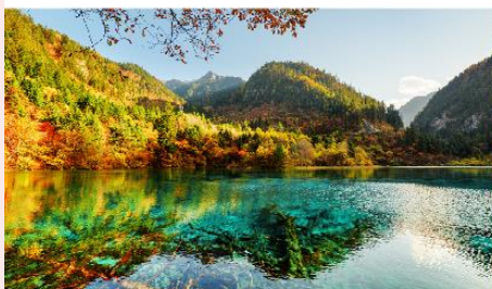
อุทยานแห่งชาติจิวฉ่ายโกว