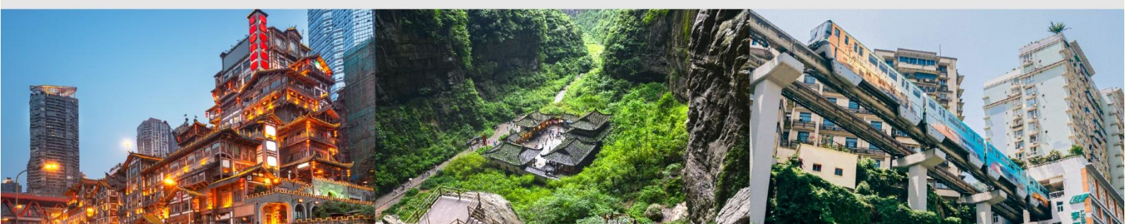
หงหยาดัง