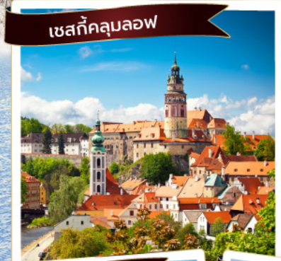
เชสทีลคูลอฟ