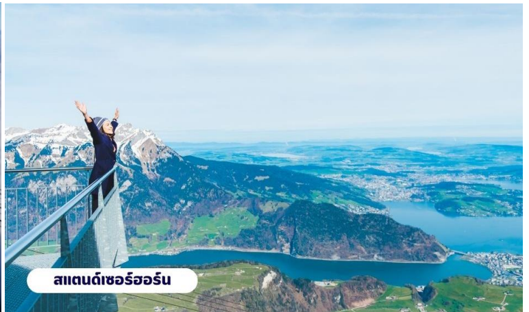
สแตนดเซอร์ฮอร์น