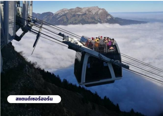
สแตนดเซอร์ฮอร์น

📍 บริการอาหารเช้า ณ ห้องอาหารของโรงแรม จากนั้นนำท่านเดินทางสู่สถานีกระเช้า เพื่อเตรียมตัวเดินทางขึ้นสู่ ยอดเขาสแตนเซอร์ฮอร์น (Mt.Stanserhorn) มีความสูงที่ 1,898 เมตร(6,227 ฟุต) ระหว่างทางคุณจะได้ชมวิวแบบพาโนรามาและให้ท่านได้สัมผัสการเดินทางโดยขึ้นกระเช้า “Cabrio” กระเช้าลอยฟ้าเปิดประทุนที่มี 2 ชั้นแห่งแรกของโลก และสามารถจุผู้โดยสารได้เกือบ 60 ท่าน โดยขึ้นดาดฟ้าจะสามารถจุได้ 30 ท่าน ระยะเกือบ 2 กิโลเมตร ระหว่างทางขึ้นสู่ยอดเขาท่านจะสามารถมองเห็นวิวแบบ 360 องศา จากนั้นให้ท่านได้เพลิดเพลินกับความสวยงามของธรรมชาติและทัศนียภาพที่งดงาม