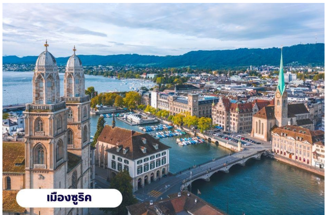
เมืองซูริค

เมืองซูริค ปัจจุบันจัตุรัสนี้ได้กลายเป็นชุมทางรถรางที่สำคัญของเมืองและยังเป็นศูนย์กลางการค้าของย่านธุรกิจ ธนาคาร สถาบันการเงินที่ใหญ่ที่สุดในประเทศ สวิตเซอร์แลนด์ นำท่านแวะถ่ายรูปกับ โบสถ์ฟรอมุนสเตอร์