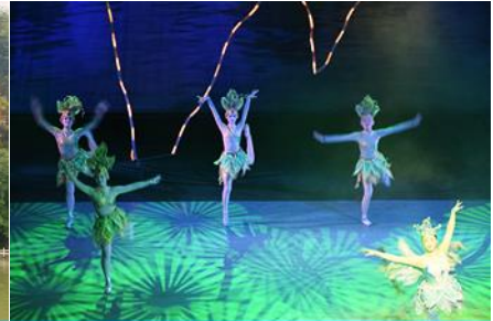
โชว์ DREAM LIKE LIJIANG