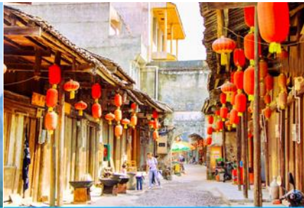
เมืองโบราณต้าชวี