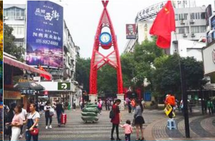
ถนนคนเดิน วิวหยาวลู่