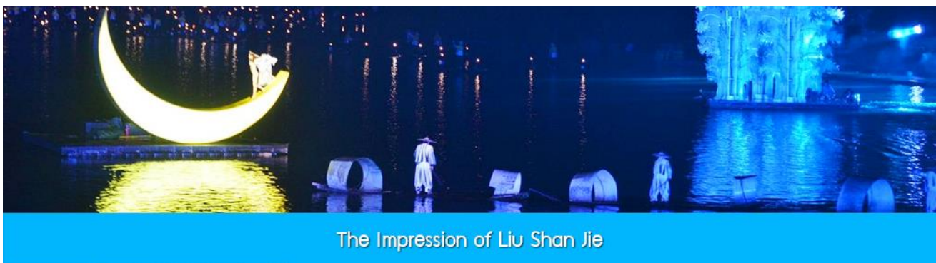
The Impression of Liu Shan Jie

อิสระอาหารมื้อค่ำเพื่อให้ท่านสามารถเลือกชมอาหารท้องถิ่นหลากหลายในย่านถนนคนเดิน