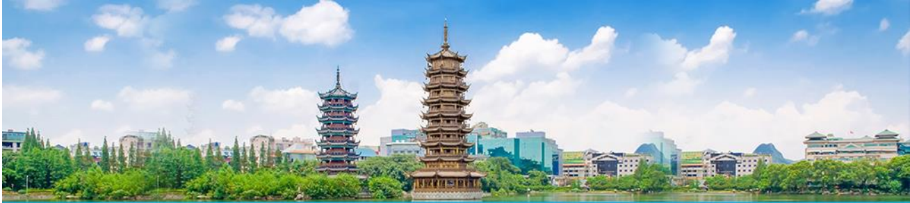
เจดีย์วิ้น เจดีย์ทอง