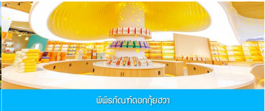
พิพิธภัณฑ์ดอกกุ้ยฮวา

วันที่หก เมืองกุ้ยหลิน – สวนหลิวซานเจีย – พิพิธภัณฑ์ดอกกุ้ยฮวา – บินกลับกรุงเทพฯ