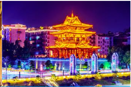
หอเขี้ยวเหย้าไหลว

วันที่ 1 เมืองหยางชัว – ภูเขาหฺงอี้ฟง – เมืองโบราณต้าชวี – เมืองกู่ยฺหลิน – ศูนย์แพทย์แผนจีน – หอเขี้ยวเหย้าไหลว – ซุปปิ้งย่านตงซีเจียง