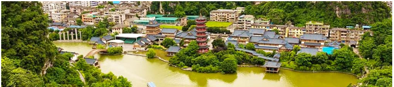
กุ้ยหลิน