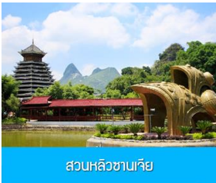
สวนหลิวซานเจีย