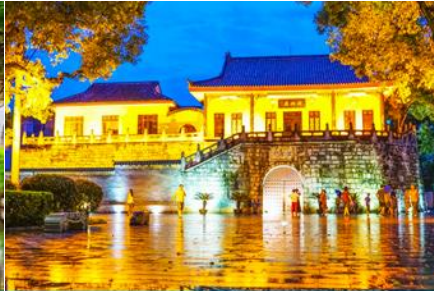
ประตูเมืองโบราณกุ๋หนานเหมิน