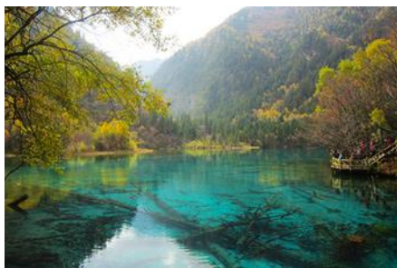
อุทยานจิวจ้าวโกว

พักที่ MINJIANG HAOTING HOTEL 4* หรือระดับ 4 ดาว พื้นเมือง