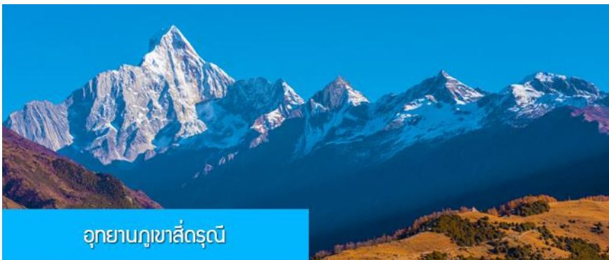
อุทยานภูเขาสี่ดรุณี

พักที่ SERENGETI HOTEL CHENGDU โรงแรมระดับ 4 ดาวท้องถิ่นหรือเทียบเท่าในเมืองเฉิงตู