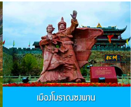
เมืองโบราณขงพาน

วันที่สาม อุทยานภูเขาสี่ครุณี-ผ่านชมวิิวภูเขาที่ราบสูง-ทะเลสาบเต้อชี- เมืองโบราณขงพาน-เมืองชวนจู่ชื่อ