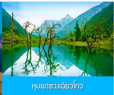
หุบเขาชวงเฉียวโกว