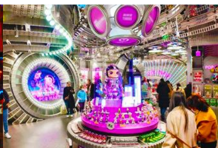
ร้าน POP MART

วันที่ห้า จิวจ้ายโกว-เงินเจียงกวน-ขึ้นรถไฟความเร็วสูง-นครเฉิงตู-ช้อปปิ้งถนนชุนชู่ร้าน POP MART