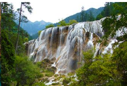
น้ำตกธารไข่มุก