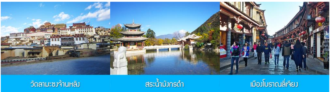
วัดลามะชวงจ้านหลิง

ที่พัก YUE GUANG HOTEL ระดับ 4 ดาว หรือเทียบเท่าเมืองจงเจียน หรือแชงกรีล่า