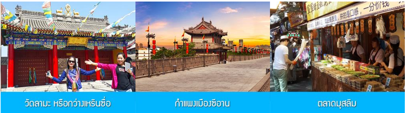
วัดลามะ หรือกว้างเหรินชื่อ

พักที่ TITAN CENTRAL PARK HOTEL 4* หรือ โรงแรมในระดับเดียวกัน เมืองซีอาน