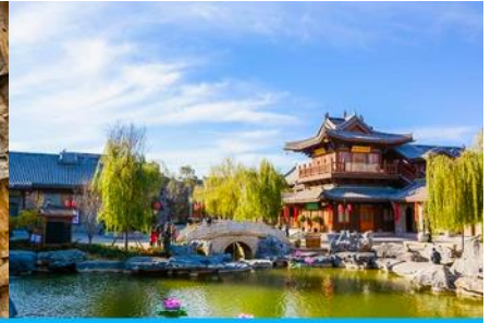
เมืองโบราณลั่วอี้