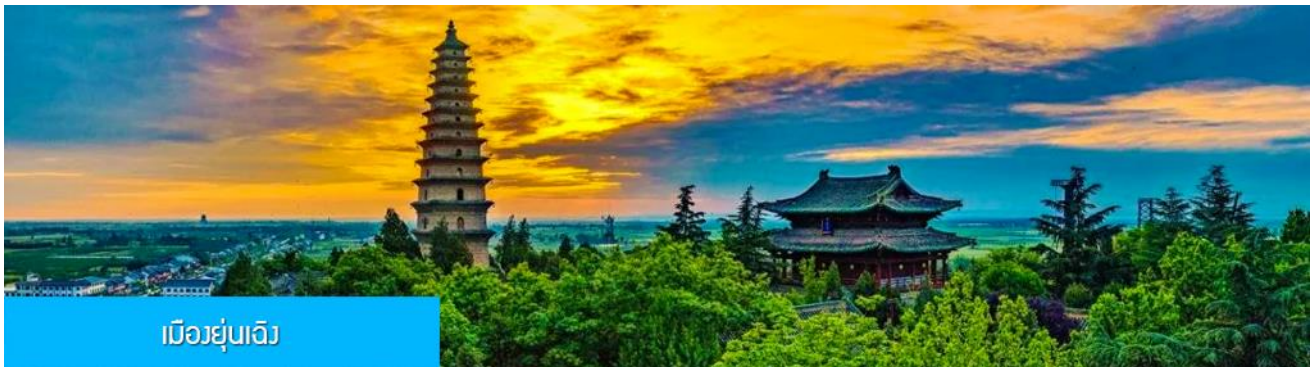
เมืองยูนเจิ้ง