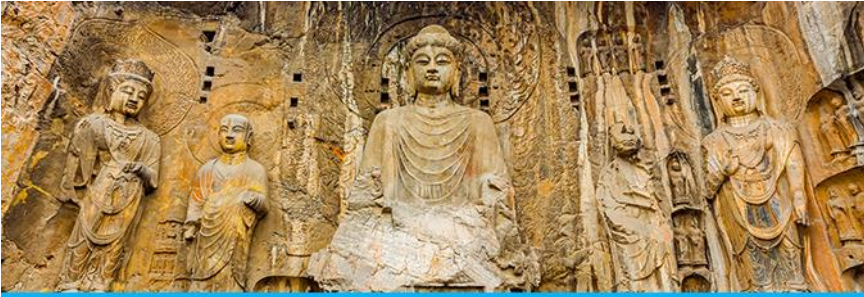
ถ้ำหินหลงเหมิน