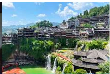
เมืองโบราณฟู่หวงเจิน