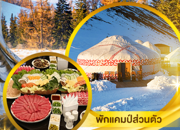
พักแคมป์ส่วนตัว