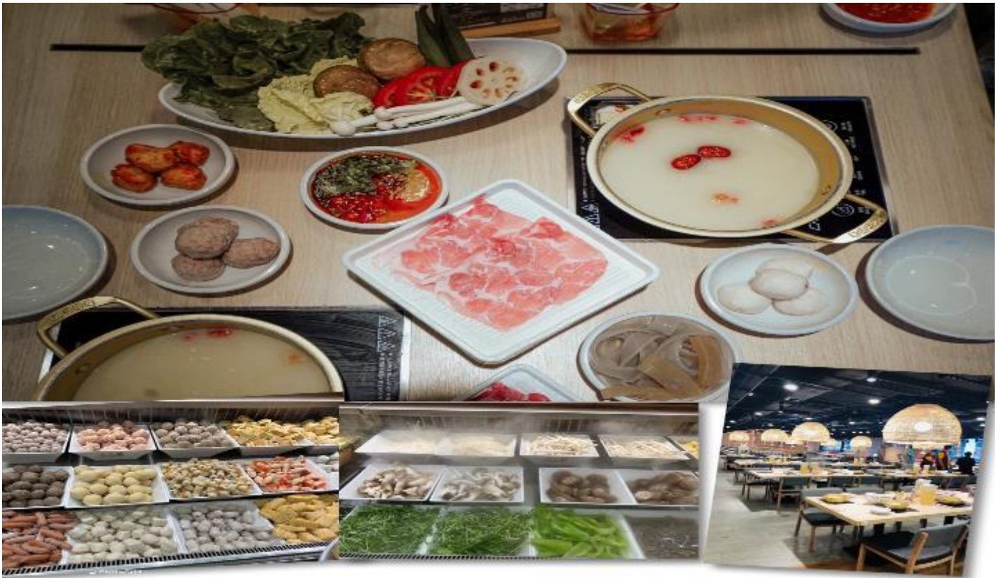
เที่ยง รับประทานอาหารเที่ยง ณ ภัตตาคาร (5) เมนูชาบู