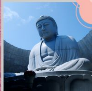
"HILL OF BUDDHA"