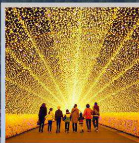
"NABANA NO SATO"