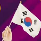
ป่าเคียว ตลาดกวางจิง