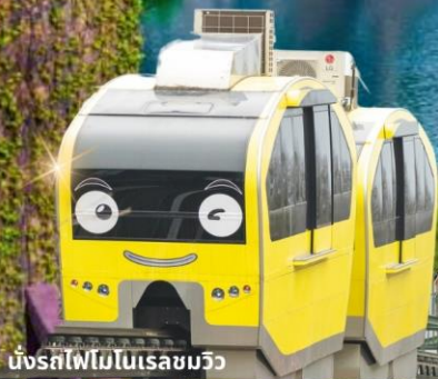
นั่งรถไฟโมโนเรลชมวิว