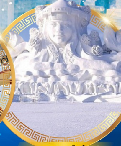
เกาะพระอาทิตย์