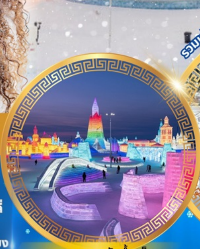
เทศกาลแกะสลักน้ำแข็ง

จตุรัสโบสถ์เซินโซเฟีย ถนนจงยง หมู่บ้านหิมะดินแดนมหัศจรรย์ อนุสาวรีย์ฝังหกง สนุกสนานกับลานสกียาปูลี่ ถนนแช่เย็นเจีย เขาแกะหลัว เขาปังจอย ภาพเขียน Ice and Snow แม่น้ำซงฮัวเจียง ไซว์ว้ายน้ำแข็ง เกาะพระอาทิตย์