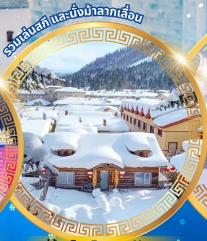
หมู่บ้านหิมะ Dream Home