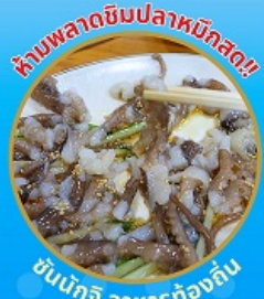
ห้ามพลาดชิมปลาหมึกสด!! ชั้นนักชี อาหารท้องถิ่น

ถ่ายรูปชิคๆ หมู่บ้านวัฒนธรรมคิมซอน ใหม่ล่าสุด คาเฟ่ริมทะเล วิวหลักล้าน ขึ้นเคเบิลคาร์ ชมทะเลปูซาน ห้ามพลาด!! ตลาดปลาที่ใหญ่ที่สุด ชิมของอร่อยที่ตลาดแฮนแด ช้อปปิ้งตลาดพื้นเมือง แหล่งช้อปปิ้งใต้ดิน ซัมซอน อิสระช้อปปิ้ง Lotte Duty Free