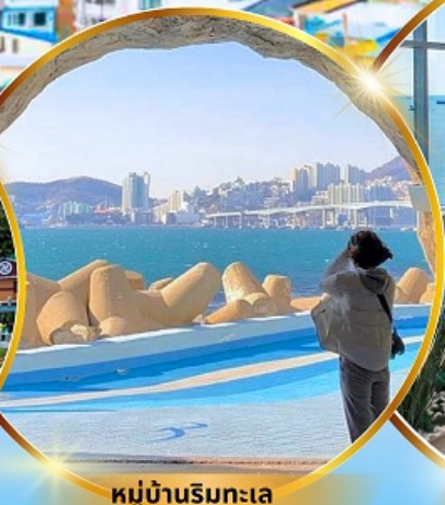
หมู่บ้านริมทะเล