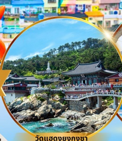
วัดแสดยงกุงซา