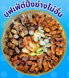
บุฟเฟ่ต์ปิ้งย่างไม่อื่น