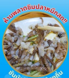
ห้ามพลาดชิมปลาหมึกสด!! ชั้นนักชี อาหารท้องถิ่น

ถ่ายรูปชิคๆ หมู่บ้านวัฒนธรรมคิมซอน ใหม่ล่าสุด คาเฟ่ริมทะเล วิวหลักล้าน ขึ้นเคเบิลคาร์ ชมทะเลปูซาน ห้ามพลาด!! ตลาดปลาที่ใหญ่ที่สุด ชิมของอร่อยที่ตลาดแฮนแด ช้อปปิ้งตลาดพื้นเมือง แหล่งช้อปปิ้งใต้ดิน ซัมซอน อิสระช้อปปิ้ง Lotte Duty Free