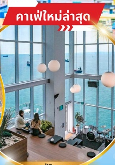
คาเฟ่ใหม่ล่าสุด