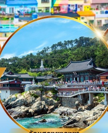
วัดแสดงยงกุงซา