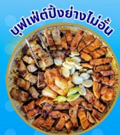
บุฟเฟ่ต์ปิ้งย่างไม่อื่น