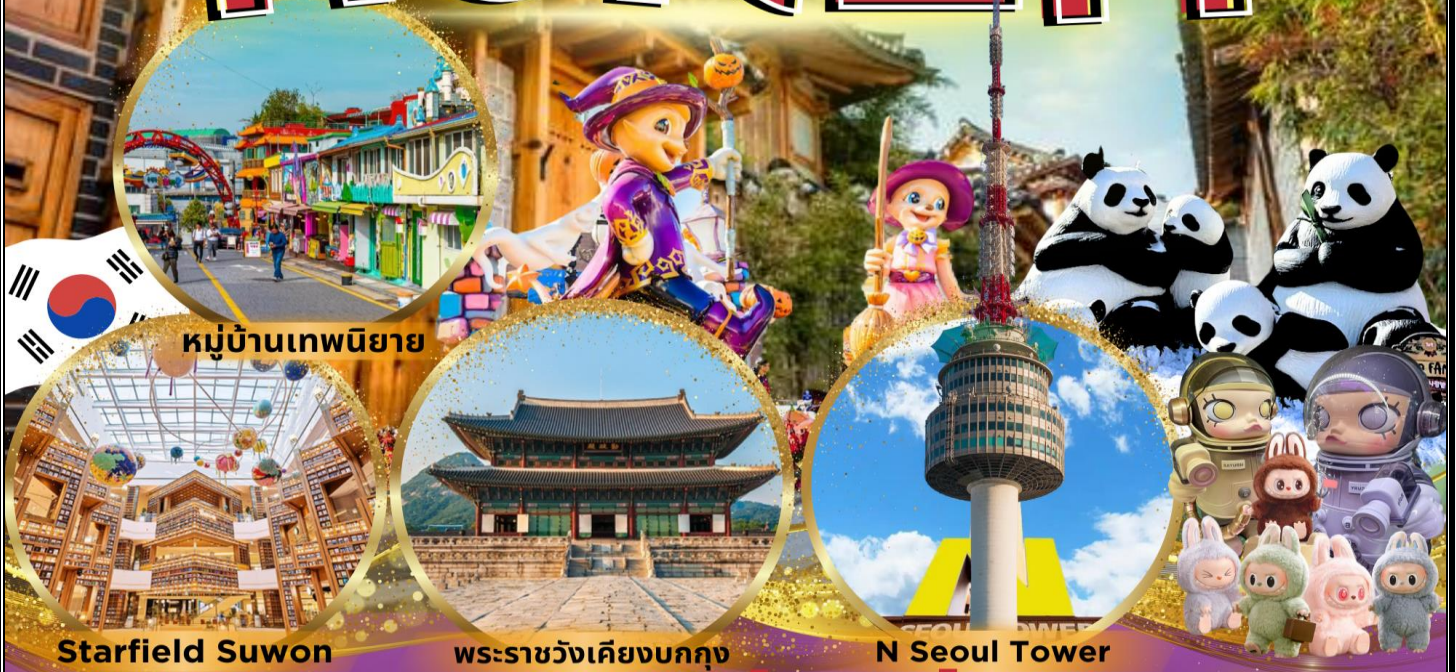
หมู่บ้านเทพนิยาย