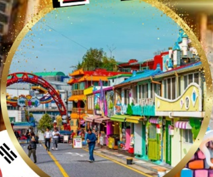
หมู่บ้านเทพนิยาย