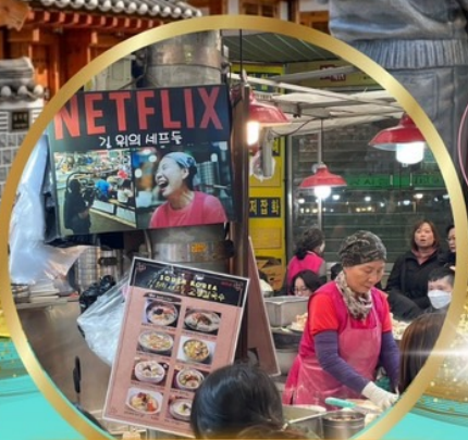
ตลาดกวางจัง