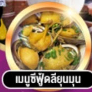
เมมูชิฟูคัสึยมนุ่น