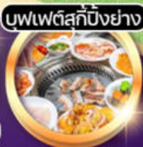
บุฟเฟ่ต์สุกปีงย่าง