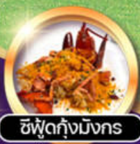
ซีฟู้ดกุ้งมังกร