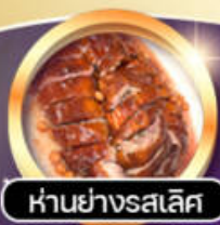
หันย่างรสเลิศ